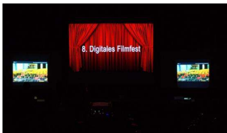
Filmfest der SMV