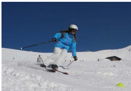
Skifahren in Bolsterlang

Am 31. Januar 2018 findet unsere Winterwander- und Kulturtag statt. Neben den traditionellen Aktivitäten aus dem Bereich des Wintersports wie Skifahren im Allgäu, Eislaufen oder Winterwandern, stehen wieder einige sportliche und kulturelle Alternativen zur Auswahl: Indoor-Soccer und Badminton, Klettern, Kunsthalle Göppingen oder das Mercedes-Benz Museum in Stuttgart. Schülerinnen und Schüler wie Lehrerinnen und Lehrer freuen sich sicher schon auf einen spannenden und erlebnisreichen Tag außerhalb des regulären Schulbetriebs.