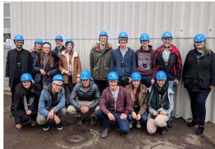
Betriebsbesichtigung bei Schuler

ein (duales) Studium voraus. Hier pflegt Schuler intensiv die enge Zusammenarbeit mit der technischen Hochschule Esslingen, vor allem am Standort in Göppingen. Der neu erbaute Schuler Innovation Tower (S.I.T.) ist ebenfalls ein Standortbekenntnis seitens der Andritz-Group, die Göppingen noch länger als Firmenhauptsitz beibehalten will.