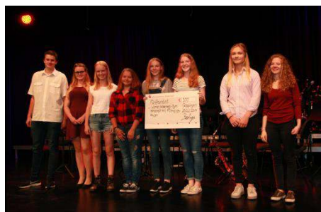
Bildungspreis für das Flüchtlings-Kino-Projekt

Die Kreissparkasse Göppingen hat im Sommer zwei unserer Schulprojekte mit je einem Bildungspreis von 500 Euro geehrt: Das Flüchtlingskinder-Kino und den Audioguide zur Picasso-Ausstellung.