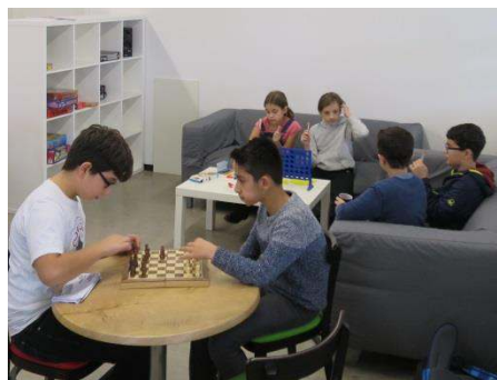
Besuch im Schülercafé