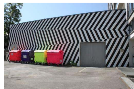
Kulturagenten-Projekt: Neugestaltung des Hintereingangs

Es entstand in Kooperation mit einem Filmemacher ein Biolehrfilm sowie mit einer Malerin ein 60 m 2 Wandbild, es gab Schauspielintensivworkshops und ein dauerhaftes Fensterlichtfolienbild, sowie konzeptionelle Arbeit mit einem Raumbildner und Theaterregisseur im Kunstunterricht. All das findet in unterschiedlichen Jahrgangsstufen statt und wird begleitet von einem Künstler und engagierten Lehrerinnen und Lehrern. Details dazu finden Sie auf unserer Homepage.