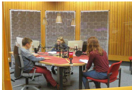
Klasse 6a im Tonstudio des SWR 2

Am 3. Dezember wurde in der städtischen Kunsthalle die Ausstellung „Pablo Picasso und die Literatur“ eröffnet. Im Vorfeld der Ausstellung hat sich die Klasse 6a des WHGs in Kooperation mit den Museumspädagogen der Kunsthalle an zwei Samstagen und über mehrere Wochen im Deutschunterricht mit Picassos Leben und Werk auseinander gesetzt und die Geschichten, zu denen er seine illustrierenden Zeichnungen und Bilder fertigte, kennen gelernt. Anschließend verwandelte sich die Klasse in eine Schreibwerkstatt: in einem kreativen Prozess entstanden Elfchen und Gedichte, ein Hörspiel zu „Carmen“, Verwandlungstexte zu den Metamorphosen des Ovid, Erzählungen zu Picassos Leben, Szenen vom Stierkampf und vieles mehr. Insgesamt schrieben die Schülerinnen und Schüler einen Skript von nahezu 40 Minuten Länge, den vorzutragen sie mit einer Professorin der Musikhochschule Stuttgart und ihren Studentinnen einübten. Die Texte wurden anschließend im Tonstudio des SWR 2 in Stuttgart professionell aufgenommen und geschnitten. Bis zum 3. Februar können Sie sich den Audioguide bei ihrem Rundgang durch die Ausstellung ausleihen und eintauchen in eine ganz besondere Interpretation von Picassos Werk. Dabei wünschen wir Ihnen viel Vergnügen!