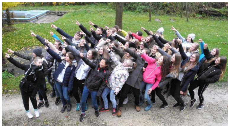
SMV-Tage auf der Sulzburg

Der Maientagsumzug und unser Auftritt beim Familiennachmittag in der EWS-Arena am Samstag, den 16. Juni 2018, wird unter dem Motto „50 Jahre WHG“